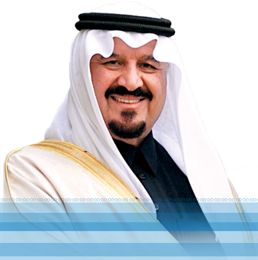
صاحب السمو الملكي الأمير سلطان بن عبدالعزيز آل سعود