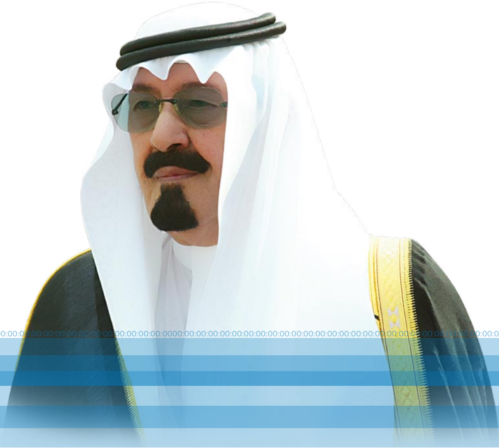
خادم الحرمين الشريفين الملك عبدالله بن عبدالعزيز آل سعود